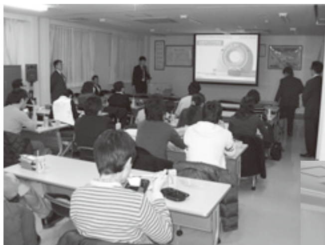
東芝メディカルシステムズ（株）講師 によるAquilion ONE™の紹介